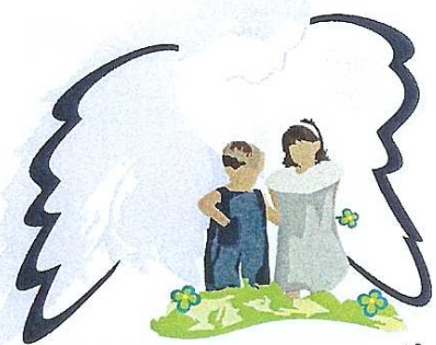
Blieskasteler Freunde und Helfer Schutzengel für Kinder e. V.